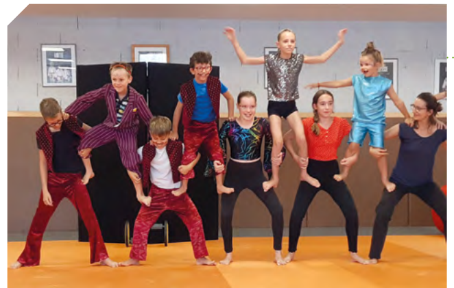
Stage de cirque

Au plaisir de vous retrouver en atelier ou en sorties et spectacles.