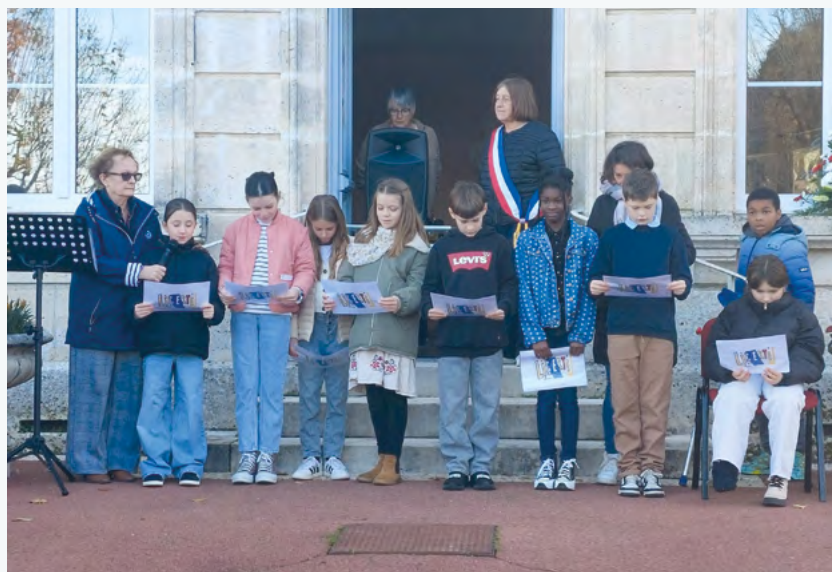
Participation des élèves à la cérémonie du 11 Novembre avec la lecture du poème « LIBERTE » de Paul Eluard

Merci de vous munir d'un justificatif de domicile.