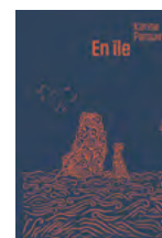
1 er Roman