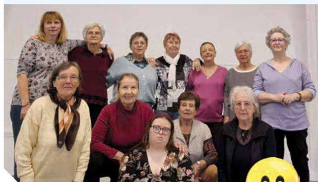
Les cavaliers sont les bienvenus !

Les séances ont lieu dans la salle polyvalente le vendredi de 14h à 16h, on vous attend.