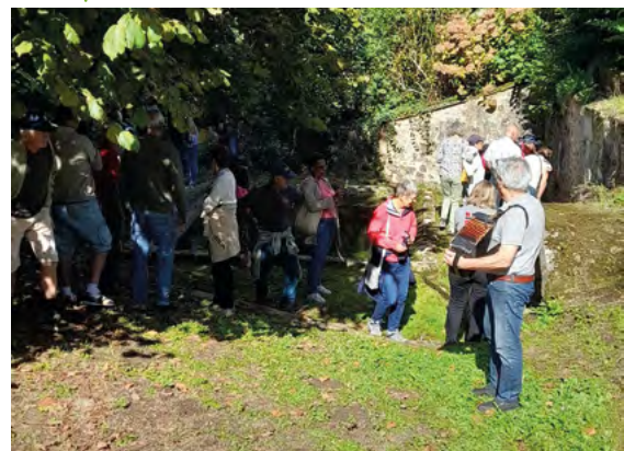
Journées européennes du patrimoine