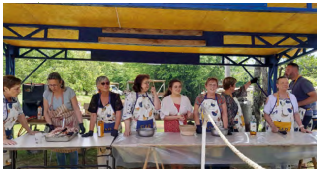
Printemps de Beaulieu