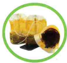
Marc de café avec filtre, sachets de thé, infusettes