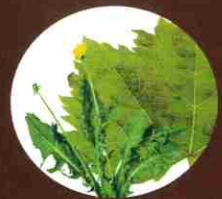
Plantes malades et mauvaises herbes germées