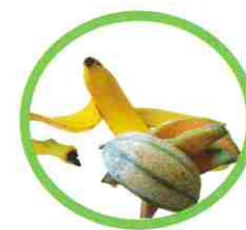
Peaux de fruits, même les agrumes, en morceaux