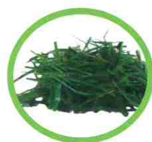
Tontes de gazon