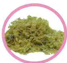
Sciure de bois non traité