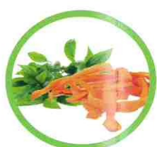
Épluchures de fruits et légumes