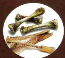
Os de viande et arêtes de poisson