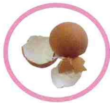
Coquilles d'œufs écrasées

Pour un compost riche et équilibré, apportez en quantité équivalente : des matières sèches et dures (riches en carbone) et des matières humides et molles (riches en azote) .