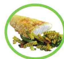
Petits restes de repas (pâtes, riz, croûtes de fromage...)