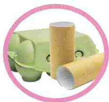
Cartons non-imprimés (boîtes à œufs...)