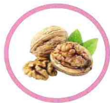
Coquilles de noix et noisettes broyées