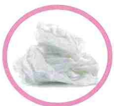
Essuie-tout blanc, serviettes papier